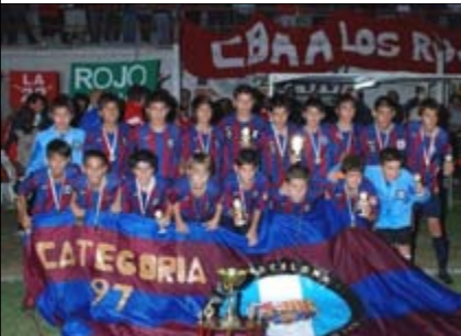
El equipo de la Filial de Barcelona, que resultó campeón.