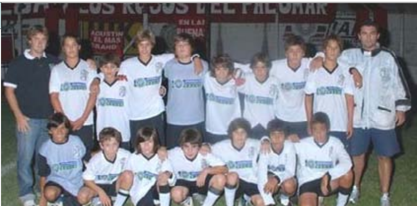
El Plantel de Atlético que disputó el torneo de verano en 9 de Julio.

Es de destacar que la 5ta. y la 6ta. se entrenan todos los días, la verdad que