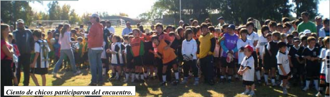
Ciento de chicos participaron del encuentro.