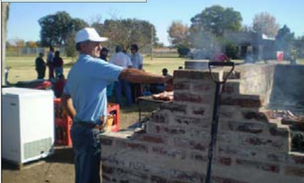
A los rico chori!!!. Uno de los papás encargado de la parrilla.