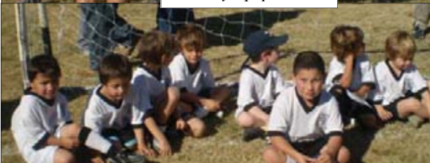
Lo que viene... Los más chiquitos, esperando el partido