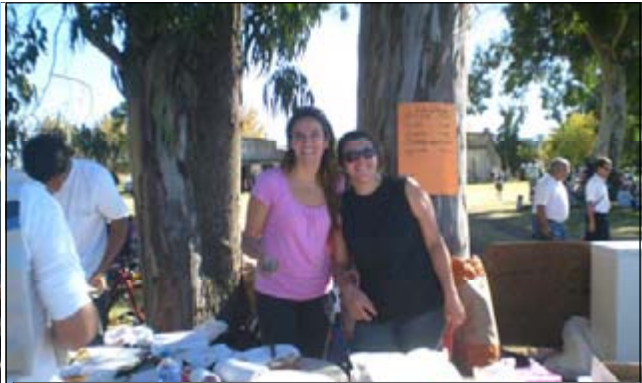
Los papás colaboraron, y mucho en la cantina Muy buen servicio.